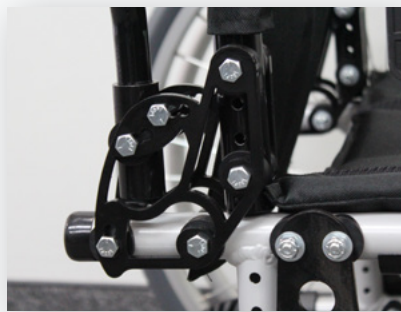
Cannes dorsales à angle réglable 0 °, 5 °, 10 ° ou 15 °