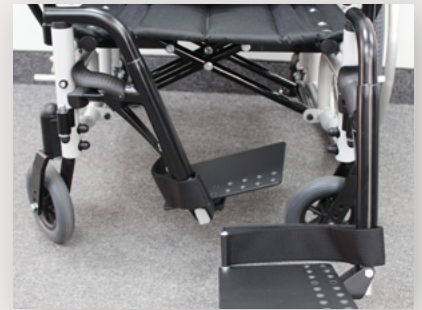
Swing In et Swing Out Front Gréement