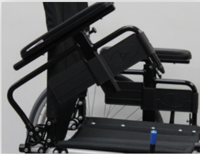
Bras à deux points