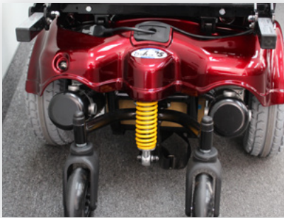
Arrière réglable Suspension