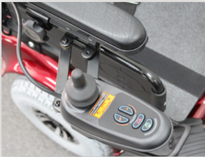
Joystick à entraînement unique PNG