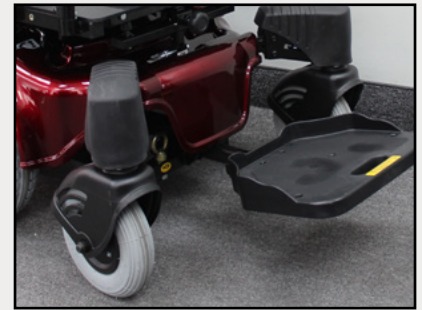
Pied standard rabattable